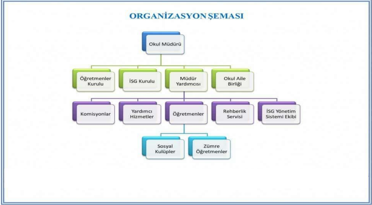
ŞEKİL 1 ORGANİZASYON ŞEMASI