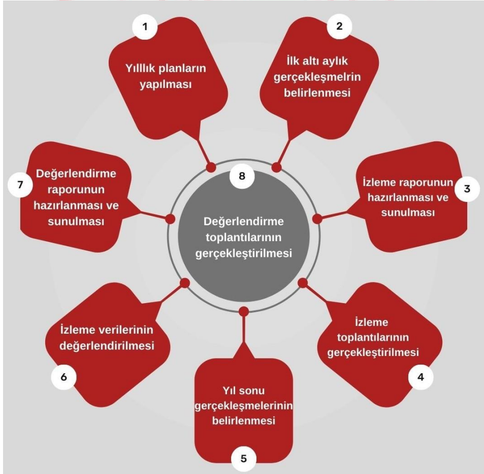
ŞEKİL 2 İZLEME VE DEĞERLENDİRME SÜRECİ

İzleme ve değerlendirme sürecinin işleyişi ana hatları ile Şekil 4'te özetlenmiştir. Lütfiye Altaş İlkokulu Müdürlüğü 2024–2028 Stratejik Planı'nda yer alan performans göstergelerinin gerçekleşme durumlarının tespiti yılda iki kez yapılacaktır. Ara izleme olarak nitelendirilebilecek yılın ilk altı aylık dönemini kapsayan birinci izleme kapsamında, Stratejik Plan İzleme ve Değerlendirme Komisyonu vasıtasıyla, harcama birimlerinden sorumlu oldukları performans göstergeleri ve stratejiler ile ilgili gerçekleşme durumlarına ilişkin veriler toplanarak konsolide edilecektir. Performans hedeflerinin gerçekleşme durumları hakkında hazırlanan "Stratejik Plan İzleme Raporu" Müdür, Müdür yardımcıları, birim amirleri ve kurum içi paydaşların görüşüne sunulacaktır. Bu aşamada amaç, varsa öncelikle yıllık hedefler olmak üzere, hedeflere ulaşılmasının önündeki engelleri ve riskleri belirlemek ve yıllık hedeflere ulaşılmasını sağlamak üzere gerekli görülebilecek tedbirlerin alınmasıdır. Yılın tamamına ilişkin ikinci izleme kapsamında ise Stratejik Plan İzleme ve Değerlendirme Komisyonu vasıtasıyla, tarafından harcama birimlerinden sorumlu oldukları performans göstergeleri ve stratejiler ile ilgili yıl sonu gerçekleşme durumlarına ait veriler toplanarak konsolide edilecektir.